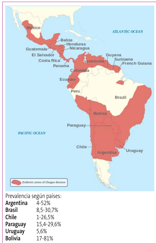
Figura 1. Distribución geográfica de la enfermedad de Chagas en América central y del Sur. Basado en un mapa publicado por SpringerImages

de ser una epidemia en dichos países a convertirse en un problema global, ya que se describen casos en un gran número de países por todo el mundo. España se ha convertido en los últimos años en un destino muy frecuente para los inmigrantes latinoamericanos.