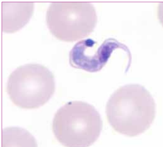
Figura 2. Trypanosoma cruzi

El Trypanosoma cruzi es agente causal de la enfermedad; se trata de un protozoo perteneciente a la familia Trypanosomatidae , que posee un cuerpo alargado con un flagelo que permite su movilización en el torrente circulatorio (Figura 2).