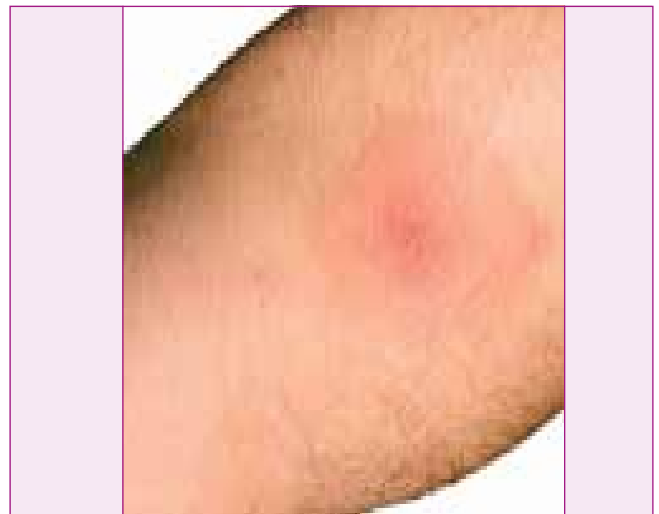
Figura 4. Chagoma inoculación

En las formas más graves, en pacientes inmunodeprimidos, tratamientos con inmunosupresores prolongados, tumores, trasplantes o en infectados por el virus de la inmunodeficiencia humana (VIH) puede presentarse como meningoencefalitis en un 79% de los casos, o miocarditis en aproximadamente un 25%. Se produzca o no