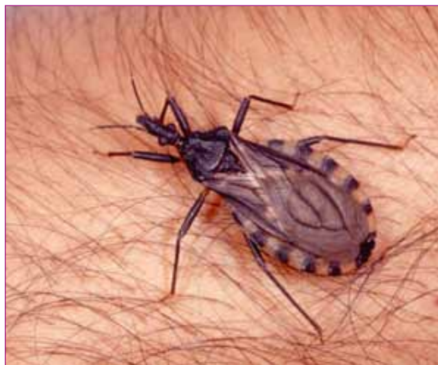
Figura 3. Trypanosoma infestans