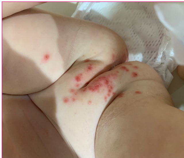
Figura 7. Afectación vulvar en enfermedad boca-mano-pie en niña de 18 meses.

El exantema de la varicela es inicialmente eritematoso y evoluciona sucesivamente a vesículas, pústulas y costras, coexistiendo lesiones en diferentes estadios evolutivos, muy pruriginosas. La distribución es centrípeta, con inicio frecuentemente en el cuero cabelludo, la cara o el tronco. No suele haber afectación palmoplantar, pero sí es frecuente la afectación de mucosas (oral, faríngea, conjuntiva o genital). El diagnóstico es clínico y la evolución suele ser benigna en la población pediátrica.