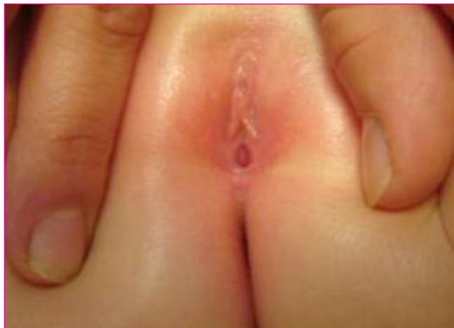
Figura 4. Adherencias labiales.