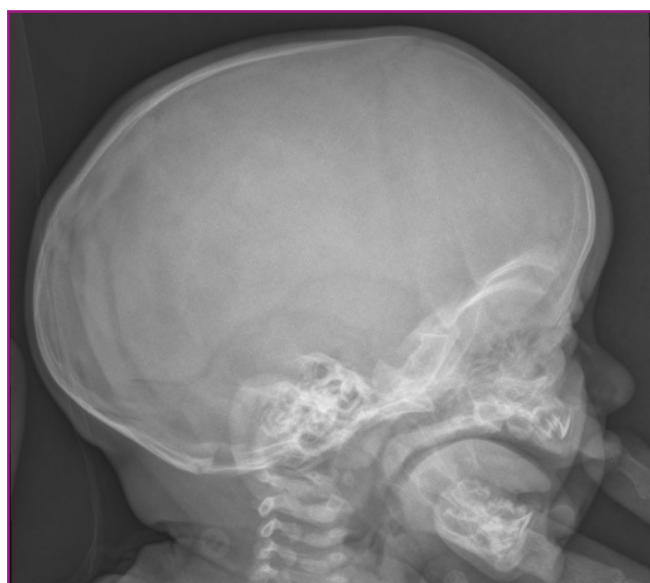
Figura 1. Radiografía lateral de cráneo del paciente